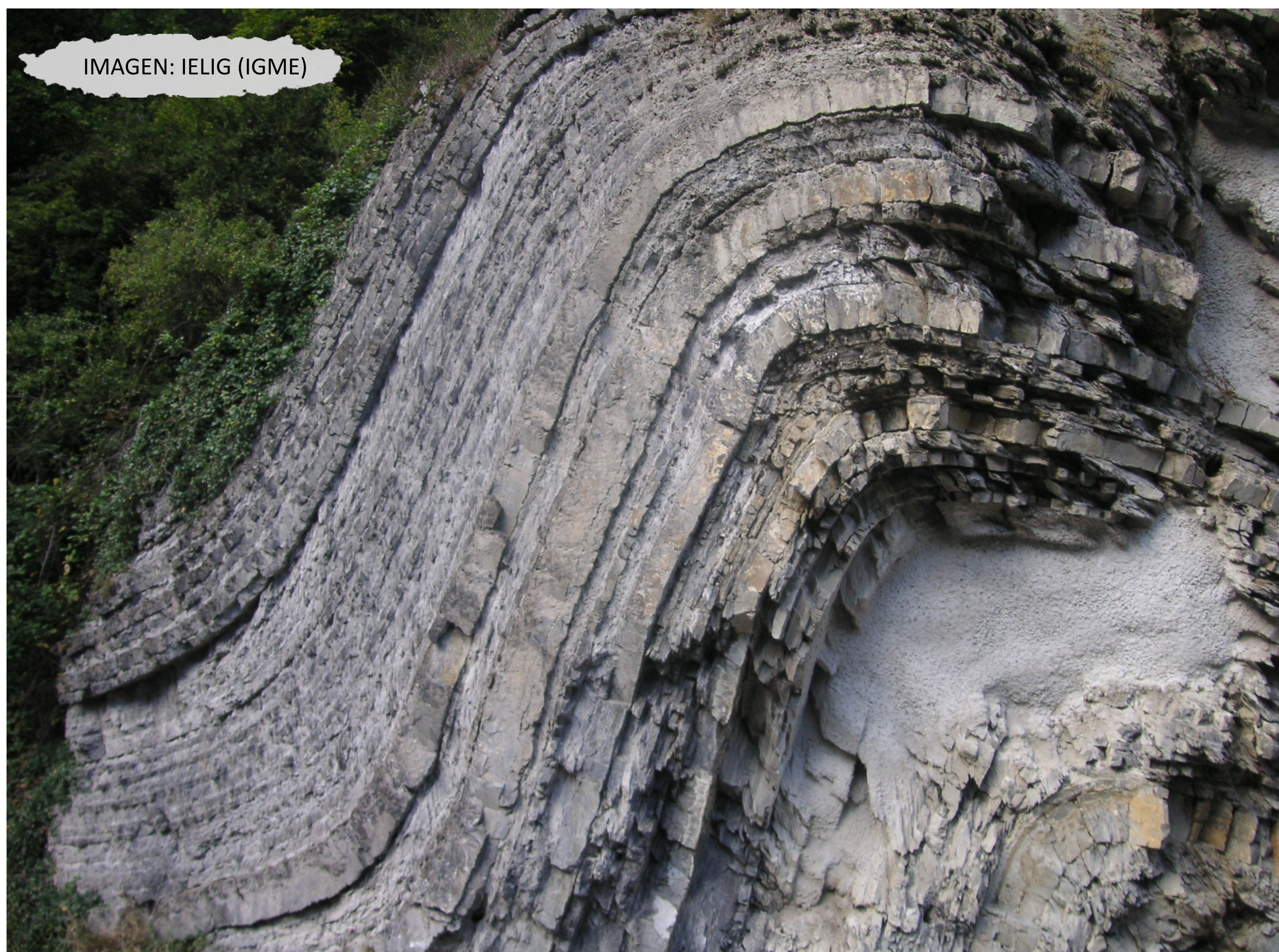
IMAGEN: IELIG (IGME)