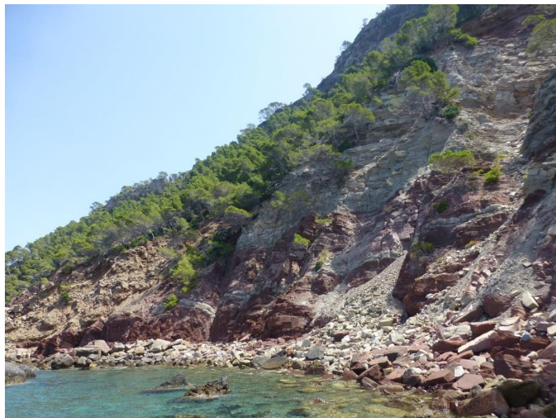
Acantilados costeros de la zona de Estellencs donde se ha hallado el “mosquito” más antiguo conocido, una larva.

En la actualidad, el fósil está siendo acondicionado en el Institut Català de Paleontologia Miquel Crusafont para su custodia permanente en Mallorca.