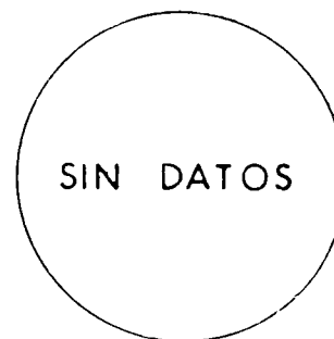
RESERVAS MUNDIALES 1987

RESERVAS MUNDIALES= Amplias RECURSOS MUNDIALES= Amplios